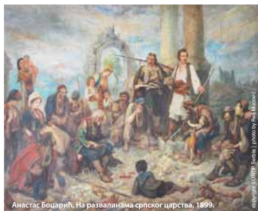
Анастас Боцарић, На развалинама српског царства, 1899.