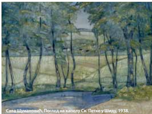
Сава Шумановић, Поглед на капелу Св. Петке у Шиду, 1938.