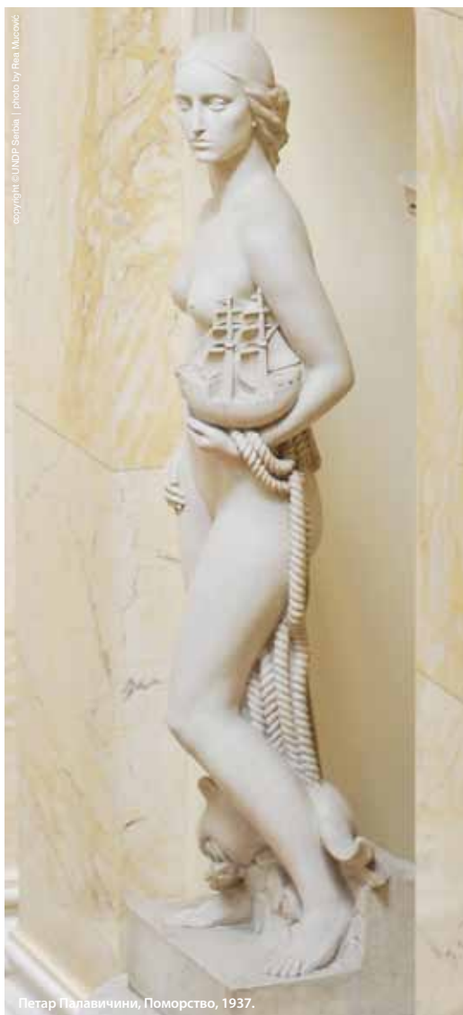
Петар Палавчини, Поморство, 1937.