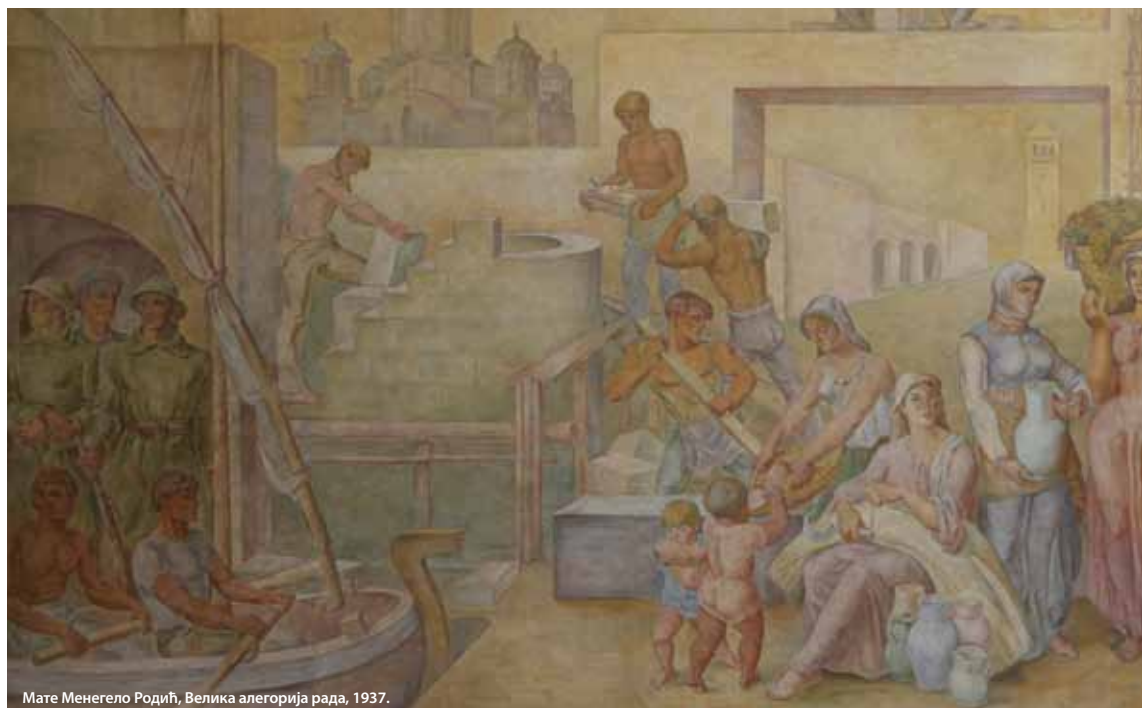
Мате Менегело Родић, Велика алегорија рада, 1937.